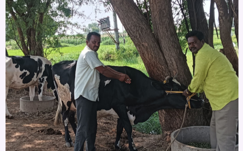
వెల్లండ, ఏప్రిల్ 23 (నీలగిరి ఎక్స్‌ప్రెస్)