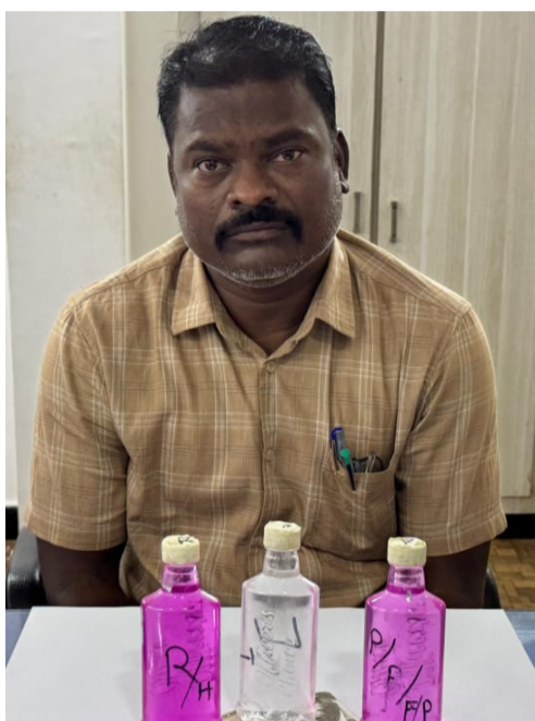
మల్కాపూర్ గ్రామంలో ఓ రైస్ మిల్లుకు విద్యుత్ కనెక్షన్ కోసం గత ఐదు నెలల క్రితం కాంట్రాక్టర్ ఘనపూర్