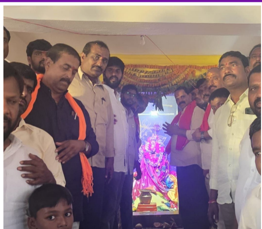
గ్రామ ప్రజలందరిపై ఉండాలని గ్రామ ప్రజలందరూ సుఖసంతోషాలతో ఆయురారోగ్యాలతో వచ్చని

-షాద్ నగర్ ఎమ్మెల్యే ప్రభుత్వ రంగ సంస్థల చైర్మన్ వీరపల్లి శంకర్.. -చెగిరెడ్డి ఘనపూర్ గ్రామంలో కోట మైసమ్మ విగ్రహ ప్రతిష్ఠ కార్యక్రమంలో పాల్గొన్న ఎమ్మెల్యే..