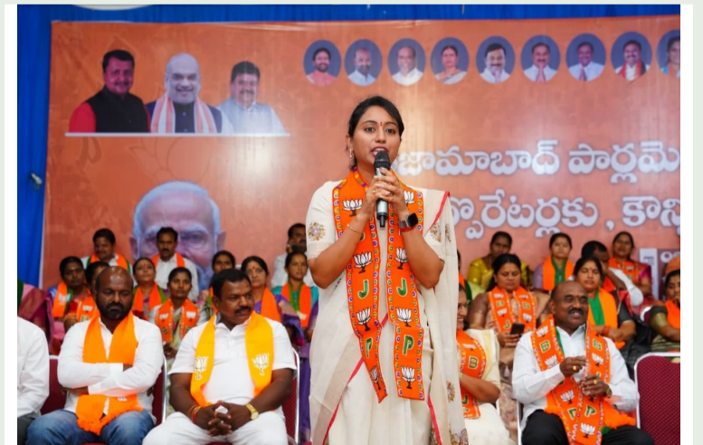
జగిత్యాల, మార్చి 6 (నీలగిరి ఎక్స్‌ప్రెస్)