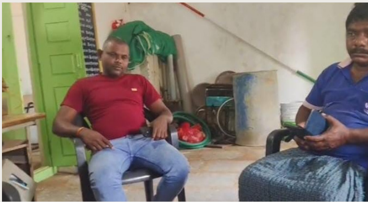
కరీంనగర్, మార్చి 23 (సీలగిరి ఎక్స్ ప్రెస్)

వీణవంక మండలం వాలభూర్ గ్రామంలో ఉద్రిక్త పరిస్థితులు నెలకొన్నాయి. గ్రామానికి చెందిన ఒక రైతు సమస్యను పరిష్కరించేందుకు వెళ్లిన ప్రజా ప్రతినిధి, సర్పంచ్ భర్తతో గ్రామ కార్యదర్శి అవమానకరంగా మాట్లాడిన ఘటన చర్చనీయాంశమైంది. గ్రామ ప్రజల తరఫున సమస్యను తెలియజేయడానికి వెళ్లిన ప్రతినిధిని కార్యదర్శి గౌరవించకుండా అసభ్యంగా మాట్లాడినట్లు సమాచారం. ఈ ఘటనతో గ్రామస్తుల్లో తీవ్ర ఆగ్రహం వ్యక్తమవుతోంది. ప్రజలకు సేవ చేయాల్సిన బాధ్యత కలిగిన అధికారులే ఇలా ప్రవర్తించడం సరైనది కాదని స్థానికులు మండిపడుతున్నారు. ప్రజల సమస్యలు చెప్పడానికి వచ్చిన ప్రతినిధులతో ఇలానే మాట్లాడితే, సాధారణ ప్రజల పరిస్థితి ఏమిటి? అని గ్రామస్తులు ప్రశ్నిస్తున్నారు. కార్యదర్శి ఒక రాజకీయ నాయకుడిలా వ్యవహరిస్తున్నాడని, అధికార దుర్వినియోగం చేస్తున్నాడని ఆరోపణలు వినిపిస్తున్నాయి. వెంటనే ఉన్నతాధికారులు స్పందించి చర్యలు తీసుకోవాలని గ్రామ ప్రజలు డిమాండ్ చేస్తున్నారు. ప్రజలకు సేవ చేయాల్సిన వ్యవస్థలోనే ఇలాంటి ఘటనలు చోటుచేసుకోవడం ఆందోళన కలిగిస్తోంది. అధికారులు స్పందిస్తారా? చర్యలు ఉంటాయా? అన్నది ఇప్పుడు హాట్ టాపిక్ గా మారింది.