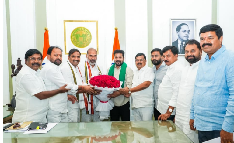
దేవరకొండ మార్చి 23. (నీలగిరి ఎక్స్ ప్రెస్).