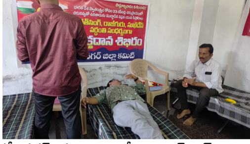
కరీంనగర్, మార్చి 23 (నీలగిరి ఎక్స్ ప్రెస్)