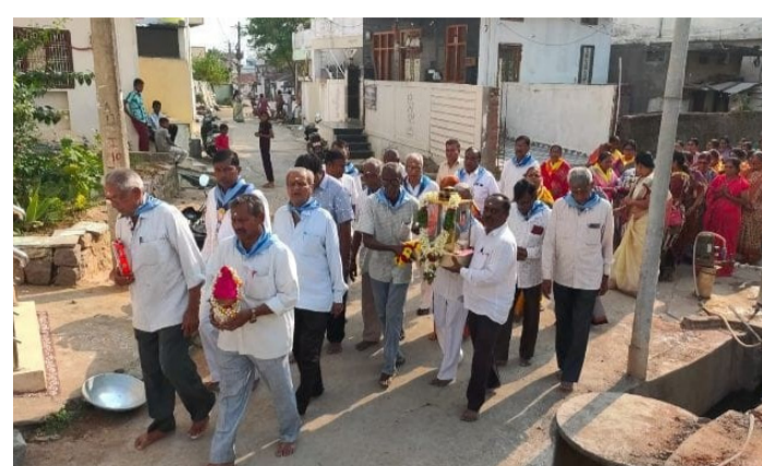
జ్యోతి ప్రారంభమైంది. హుస్సాబాద్కు రావడం భక్తులందరికీ అదృష్టం" అని పేర్కొన్నారు. ప్రపంచంలోని 75 దేశాల ప్రజలు స్వామి సేవలో