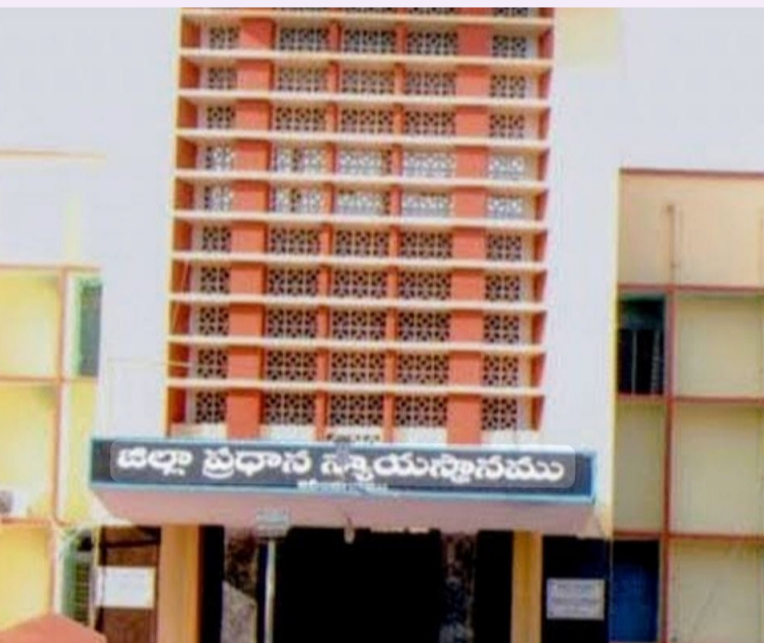
కరీంనగర్, మార్చి 17 (సీనియర్ ఎడిటర్):