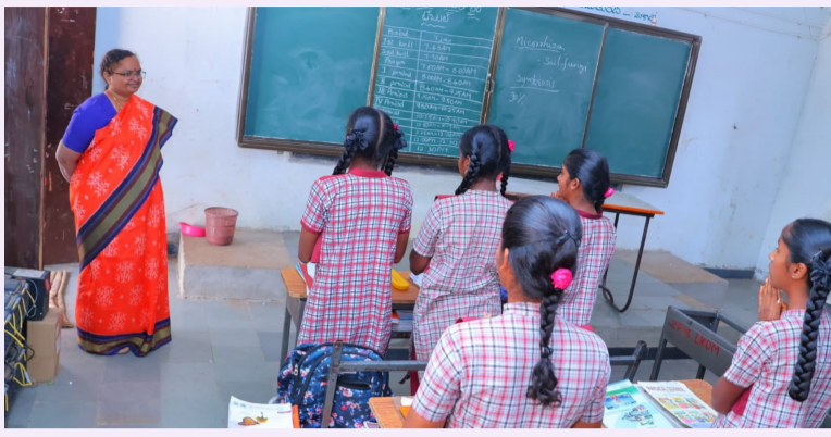
సిద్దిపేట, మార్చి 17 (సీనియర్ ఎడిటర్):