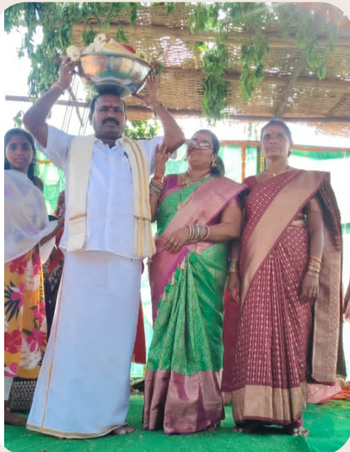
అనంత శ్రీరామచంద్రుడి జన్మదినమైన చైత్ర శుద్ధ నవమి హిందువులకు అత్యంత విశేషమైన