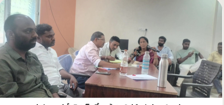
గ్రామపంచాయతీ షెడ్యూల్ వేలంపాట నిర్వహిస్తున్న అధికారులు