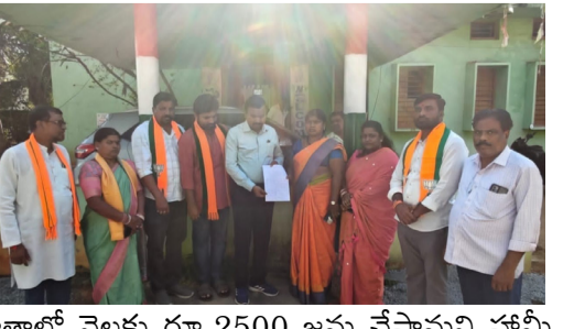
భాతాల్ నెలకు రూ. 2500 జమ చేస్తామని హామీ ఇచ్చిందని, అయితే ఇప్పటి వరకు ఆ హామీ