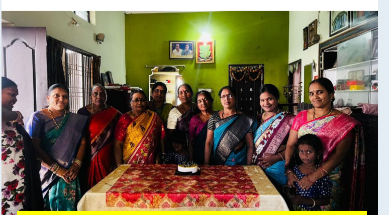
ఎలిగేడు లో ఆర్జువైశ్య మహిళా సంఘం ఆధ్వర్యంలో అంతర్జాతీయ మహిళా దినోత్సవ వేడుకలు.