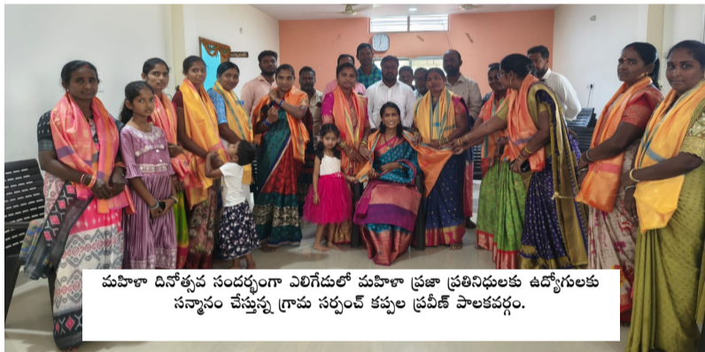
మహిళా దినోత్సవం సందర్భంగా ఎలిగేడులో మహిళా ప్రజా ప్రతినిధులకు ఉద్యోగులకు సన్మానం చేస్తున్న గ్రామ సభ్యుల కృప ప్రవీణ్ పాలకవర్గం.