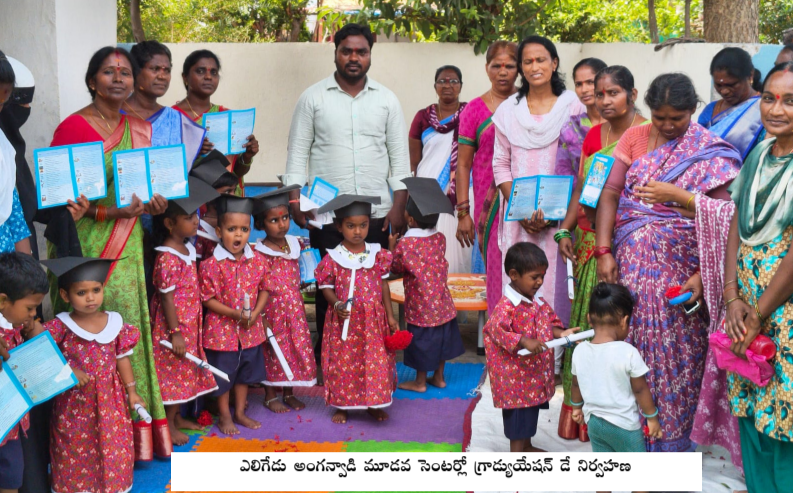
ఎలిగిడు అంగన్వాడీ మూడవ సెంటర్లో గ్రామ్యయేషన్ డే నిర్వహణ