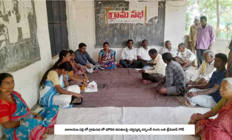
నారాయణ పల్లి లో గ్రామంలో పంచాయతీరాజ్ దినోత్సవం సందర్భంగా ప్రజలకు సేవలు అందించే కార్యక్రమం.