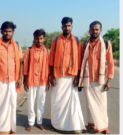
కొండగట్టు కు పాదయాత్ర గా వెళుతున్న లలిత పల్లె హనుమాన్ భక్తులు.