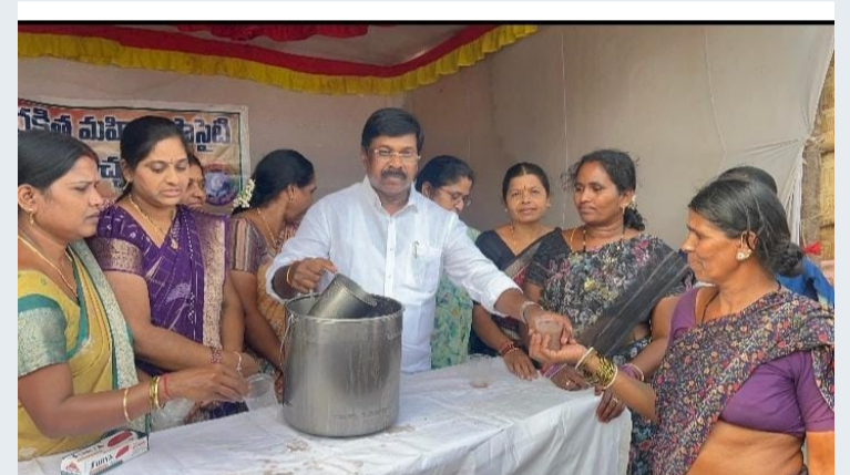
అమరాబాద్, మార్చి 31 (నీలగిరి ఎక్స్ ప్రెస్)