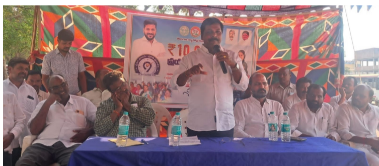
అప్పంపేట, మార్చి 31 (నీలగిరి ఎక్స్ ప్రెస్):