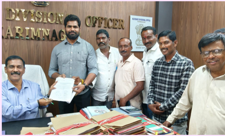
గన్నేరుపరం, మార్చి 31 (నీలగిరి ఎక్స్ ప్రెస్)

గన్నేరుపరం మండలం మైలారం గ్రామంలోని డి--8 ఉపకాలువ పనులు అసంపూర్తిగా ఉండడంతో సాగునీరు అందక రైతులు తీవ్ర ఇబ్బందులు పడుతున్నారు. సర్వే సంఖ్యలు 312, 313 వద్ద పనులు నిలిచిపోవడంతో 300 మందికిపైగా రైతులకు చివరి ఆయకట్టు పరకు నీరు చేరకపోవడం సమస్యగా మారింది. ఈ సేవధ్యంలో రైతులు సోమవారం ఆర్డీవోకు వినిపిస్తూ అందజేశారు. పలుమార్లు విన్నవించినా అధికారులు పట్టించుకోవడంలేదని, వెంటనే చర్యలు తీసుకుని సాగునీరు అందించాలని రైతులు డిమాండ్ చేశారు.