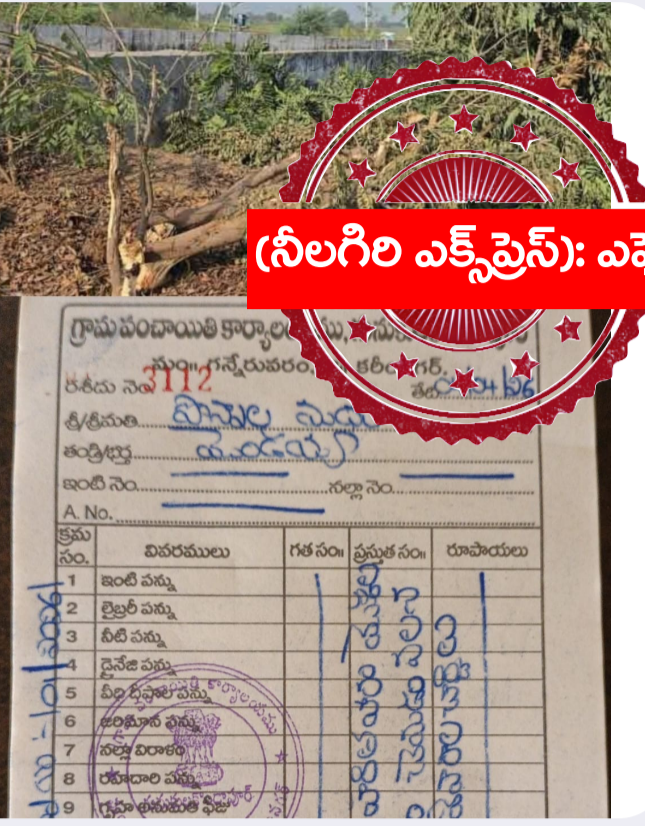
(నీలగిరి ఎక్స్‌ప్రెస్): ఎఫ్ఐక్

గన్నేరువరం, ఏప్రిల్ 04 (నీలగిరి ఎక్స్‌ప్రెస్):