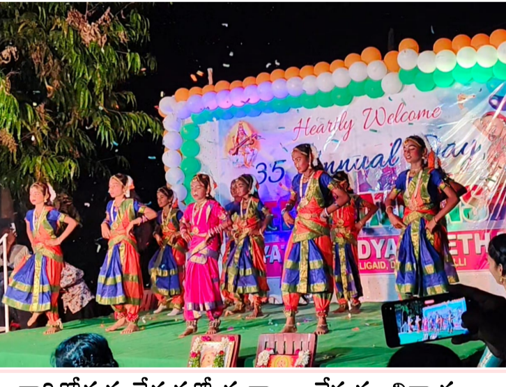
వార్షికోత్సవ వేడుకల్లో నృత్యాలు చేస్తున్న చిన్నారులు