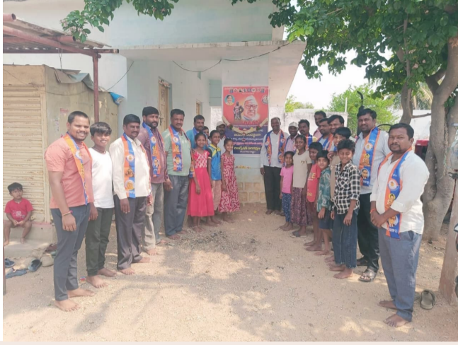
వ్యవసాయ, కార్మిక శాఖల మంత్రిగా అవినీతి మరకలేకుండా సేవలందించారు. భారత్ -- పాక్ యుద్ధ సమయంలో రక్షణ మంత్రిగా దేశానికి విజయాన్ని అందించిన ఘనత ఆయనకే దక్కింది.