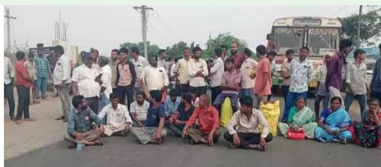
షాద్ నగర్, ఏప్రిల్ 15 (నీలగిరి ఎక్స్ ప్రెస్):

వంట గ్యాస్ సరఫరాలో తీవ్ర జాప్యం కారణంగా వినియోగదారులు ఆవేదనతో రోడ్లెక్కారు. షాద్ నగర్--వరిగి ప్రధాన రహదారిపై బైటాయింది నిరసన వ్యక్తం చేశారు. దీంతో రహదారిపై వాహనాలు నిలిచిపోయి ప్రయాణికులు తీవ్ర ఇబ్బందులు ఎదుర్కొన్నారు. కొందరు మండల కేంద్రంలోని భవాని గ్యాస్ ఏజెన్సీ గత పదిహేను రోజులుగా సిలిండర్ల సరఫరా నిలిపివేసిందని వినియోగదారులు ఆరోపించారు. తమ పనులను వదులుకుని ఏజెన్సీ కార్యాలయం ముందు గంటల తరబడి నిరీక్షించినా ఫలితం లేకపోవడంతో చివరకు ధర్నాకు దిగామని వారు ఆవేదన వ్యక్తం చేశారు. అధికారులకు ఫిర్యాదు చేసినా స్పందన లేకపోవడంతోనే ఈ ఆందోళనకు దిగాల్సి వచ్చిందని పేర్కొన్నారు. వెంటనే పెండింగ్లో ఉన్న సిలిండర్లను సరఫరా చేయాలని, సివిల్ సప్లై అధికారులు రంగంలోకి దిగి ఏజెన్సీ పనితీరుపై పర్యవేక్షణ చేపట్టాలని, వంట గ్యాస్ కొరతకు శాశ్వత పరిష్కారం చూపాలని వినియోగదారులు డిమాండ్ చేశారు. తమ సమస్యలను ప్రభుత్వం, సంబంధిత శాఖాధికారులు వెంటనే పరిష్కరించకపోతే ఆందోళన మరింత ఉధృతం చేస్తామని హెచ్చరించారు.