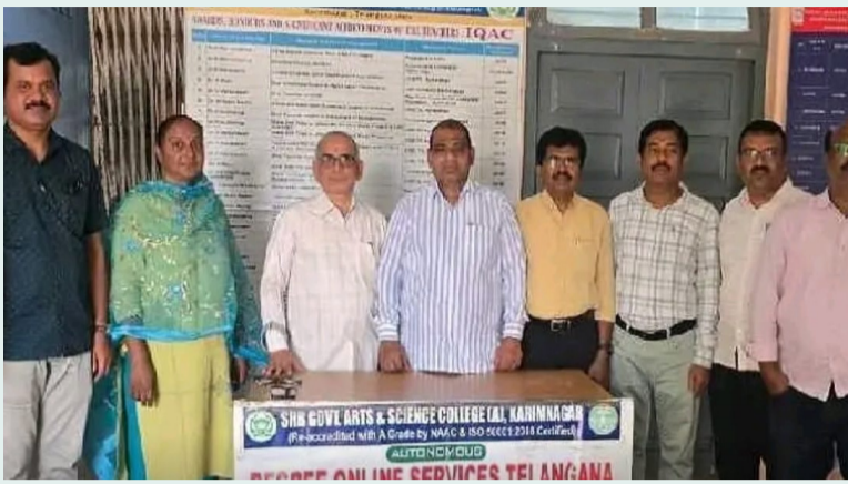
కరీంనగర్, ఏప్రిల్ 15 (నీలగిరి ఎక్స్ ప్రెస్)