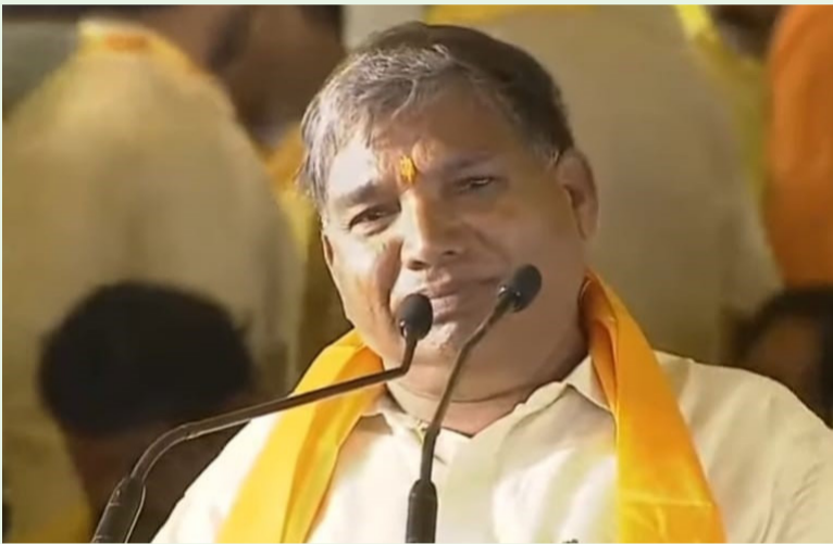
షాద్ నగర్, ఏప్రిల్ 15 (నీలగిరి ఎక్స్ ప్రెస్):