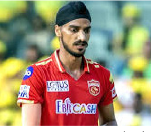
బాల్కి రాహుల్ తెవారియా ఫోర్ కొట్టడంతో అర్షీవ్ సింగ్ గతి తప్పాడు. ఇక ఫోర్ బాల్స్ నో బాల్గా వేసిన అర్షీవ్ సింగ్.. ఆ తరువాత వరుసగా రెండు బాల్స్ వైదగా వేశాడు. నాలుగో బాల్కి పరుగులు

పంజాబ్ కింగ్స్ స్టార్ పేసర్ అర్షీవ్ సింగ్ ఓ చెత్త రికార్డును మూటగట్టుకున్నాడు. ఐపీఎల్ 2026లో భాగంగా మంగళవారం గుజరాత్ ట్రెటాన్స్, పంజాబ్ కింగ్స్ జట్ల మధ్య మ్యాచ్ జరిగిన సంగతి తెలిసిందే. ఈ మ్యాచ్లో అర్షీవ్ సింగ్ లాంగ్ స్ట్రైక్ ఓవర్ వేసి అందరినీ ఆశ్చర్యపరిచాడు. గుజరాత్ ఇన్వింగ్స్ ఆఖరి ఓవర్లో ఈ ఘటన జరిగింది. ఒక ఓవర్లో 6 బంతులు వేయాల్సి ఉండగా.. ఏకంగా 11 బంతులు వేసి చెత్త రికార్డును నమోదు చేశాడు. ఫస్ట్ బ్యాటింగ్ చేసిన గుజరాత్ ట్రెటాన్స్ 19 ఓవర్లు పూర్తయ్యే సరికి 6 వికెట్ల సాఫ్టానికి 150 రన్స్ చేసింది. క్రీజులో షారుఫ్ ఖాన్, రాహుల్ తెవారియా ఉండగా.. 20వ ఓవర్ను అర్షీవ్ సింగ్ వేశాడు. అయితే మొదటి బాల్ని వైదగా వేశాడు. ఆ తరువాత వరుసగా రెండు బాల్స్ వేయగా.. పరుగులు ఏమీ రాలేదు. అయితే.. మూడో