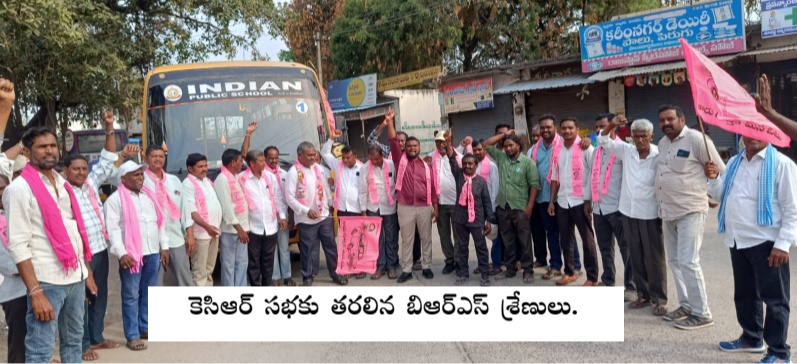
కేసీఆర్ సభకు తరలివెళ్లిన బిఆర్ఎస్ శ్రేణులు.