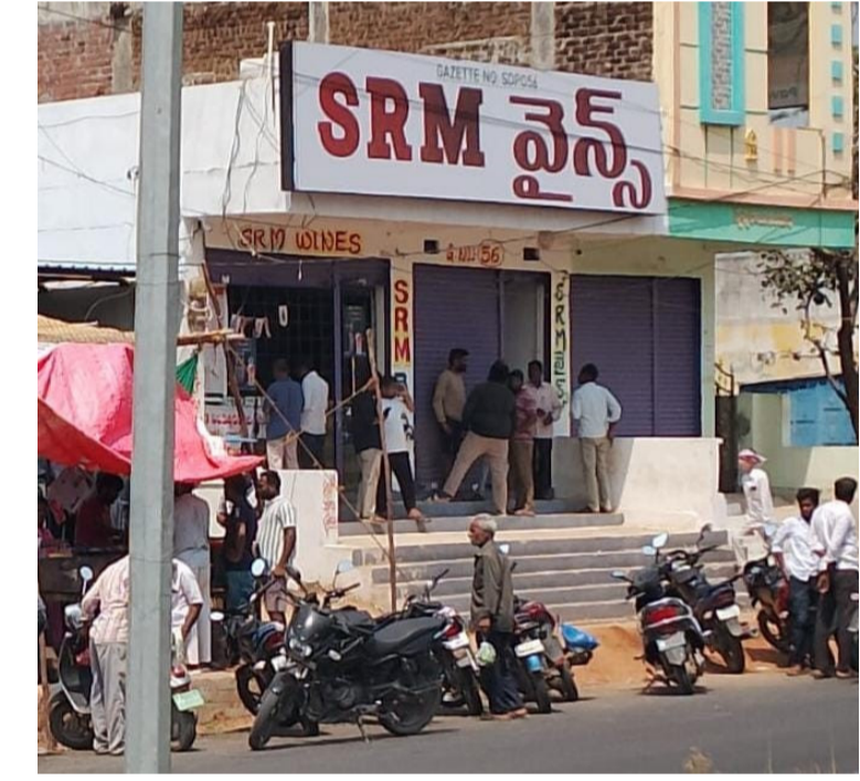
హుస్సాబాద్, ఏప్రిల్ 03 (నీలగిరి ఎక్స్‌ప్రెస్) :