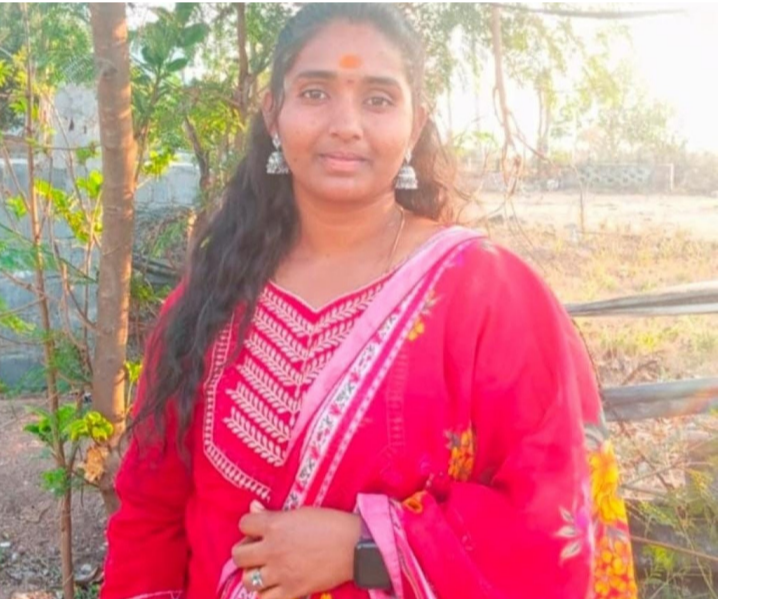
కరీంనగర్ రూరల్, ఏప్రిల్ 03 (నీలగిరి ఎక్స్‌ప్రెస్)