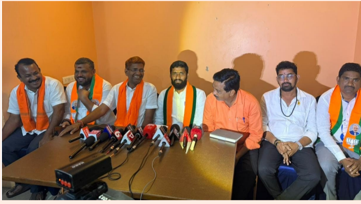
కరీంనగర్, ఏప్రిల్ 03 (సీలగిరి ఎక్స్‌ప్రెస్)