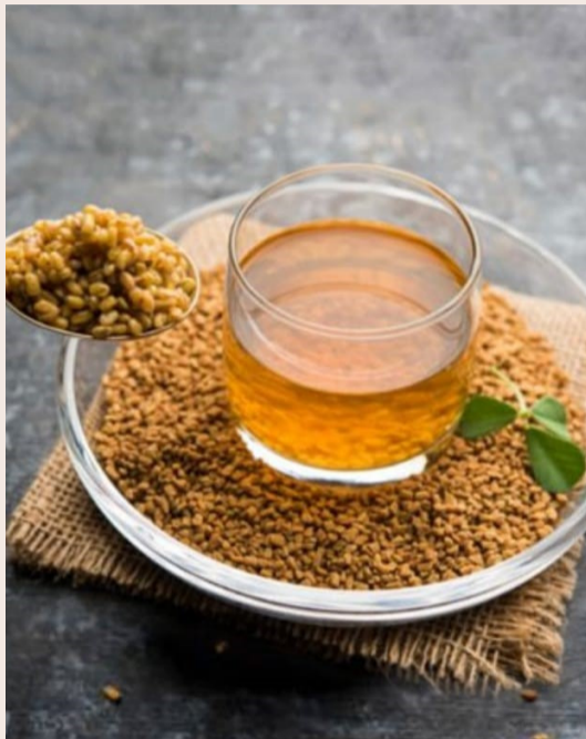
తీసుకుంటే మొత్తం ఆరోగ్యం మెరుగుపడే అవకాశం ఉంటుంది. మెంతుల నీరు తయారీ విధానం ఒక గ్లాసు నీటిలో ఒక టేబుల్ స్పూన్ మెంతులను వేసి రాత్రంతా నానబెట్టాలి. ఉదయం లేవగానే ఆ

నేటి వేగవంతమైన జీవనశైలిలో ఆరోగ్యాన్ని కాపాడుకోవడం చాలా ముఖ్యమైంది. ఈ నేపథ్యంలో సహజ పద్ధతుల్లో ఆరోగ్యాన్ని మెరుగుపరుచుకునే మార్గాలలో మెంతుల నీరు ఒక ఉత్తమ పానీయంగా ఆరోగ్య నిపుణులు సూచిస్తున్నారు. రాత్రంతా నానబెట్టిన మెంతుల నీటిని ఉదయం పరగడుపున తాగడం వల్ల అనేక ఆరోగ్య ప్రయోజనాలు లభిస్తాయని నిపుణులు చెబుతున్నారు. మెంతులలో ఉండే పోషకాలు శరీరంలోని మెటబాలిజాన్ని పెంచి బరువు తగ్గడానికి సహాయపడతాయి. అలాగే రక్తంలో చక్కెర స్థాయిలను నియంత్రించడంలో కూడా మెంతుల నీరు ఉపయోగపడుతుంది. రోజూ ఈ నీటిని తాగడం వల్ల శరీరానికి శక్తి పెరగడంతో పాటు జీర్ణవ్యవస్థ కూడా మెరుగుపడుతుంది. ప్రత్యేకంగా షుగర్ సమస్య ఉన్నవారికి మెంతుల నీరు ఉపయోగకరంగా ఉంటుందని వైద్య నిపుణులు సూచిస్తున్నారు. అదేవిధంగా ఇది శరీరంలోని కొవ్వును కరిగించడంలో కూడా సహాయపడుతుంది. క్రమం తప్పకుండా