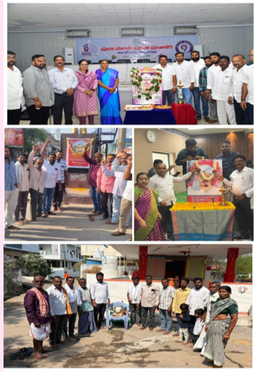
కరీంనగర్/హుస్సాబాద్/ మంచిర్యాల/పెద్దపల్లి, ఏప్రిల్ 03 (నీలగిరి ఎక్స్‌ప్రెస్)

తెలంగాణ సాయుధ రైతాంగ పోరాట తొలి అమరుడు దొడ్డి కొమురయ్య జయంతి వేడుకలు జిల్లాల వ్యాప్తంగా ఘనంగా నిర్వహించబడ్డాయి. కరీంనగర్ కలెక్టరేట్ ఆడిటోరియంలో అధికారులు, కురుమ సంఘం ప్రతినిధులు నివాళులర్పించగా, హుస్సాబాద్ అంబేద్కర్ చౌరస్తాలో కురుమ సంఘం ఆధ్వర్యంలో ప్రజలు పెద్ద సంఖ్యలో పాల్గొన్నారు. కరీంనగర్