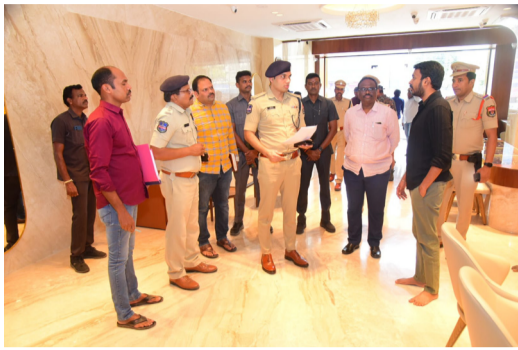
సూచించారు. అత్యవసర సమయాల్లో అప్రమత్తం చేయడానికి ఎమర్జెన్సీ అలారమ్స్ ఏర్పాటు చేసి, వాటిని పోలీస్ వ్యవస్థతో అనుసంధానం చేయాలని ఆదేశించారు. హోటళ్లలో గదులు అద్దెకు ఇచ్చే