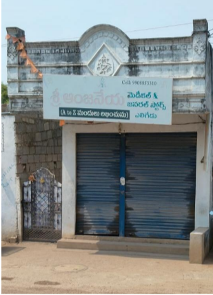
ఎలిగేడు మండల కేంద్రంలో మూసీ ఉన్న మెడికల్ షాప్

ఎలిగేడు, మే 20 (నీలగిరి ఎక్స్ ప్రెస్): అఖిల భారత కెమిస్ట్రీలు, డ్రగ్స్ షాపుల పిలుపు మేరకు దేశవ్యాప్త మెడికల్ షాపుల బండ్ లో భాగంగా ఎలిగేడు మండల కేంద్రంలో పాటు ధూళికట్ట, సుల్తానాపూర్, ముప్పిరి తోట గ్రామాల్లో మెడికల్ షాపులు బుధవారం మూతపడ్డాయి. ఈ సందర్భంగా మెడికల్ షాప్ యజమానులు మాట్లాడుతూ, "ఆన్లైన్ ద్వారా మందుల విక్రయం ప్రజాలోగ్యానికి ప్రమాదకరం. ఇటువంటి అక్రమాలను అరికట్టి, మా న్యాయమైన సమస్యలను ప్రభుత్వం వెంటనే పరిష్కరించాలి" అని విజ్ఞప్తి చేశారు.