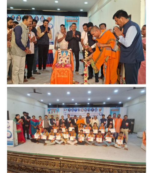
సన్మానించారు. ఈ కార్యక్రమం ద్వారా ప్రభుత్వ