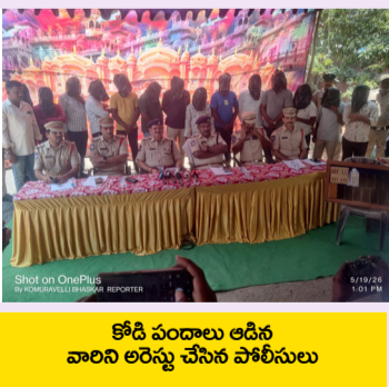
కోడి పందాలు ఆడిన వారిని అరెస్టు చేసిన పోలీసులు

ఎలిగేడు మండలం శివపల్లి గ్రామం శివారులోని బోడా గుట్ట వద్ద రహస్యంగా, చట్టవిరుద్ధంగా కోడిపందాలు నిర్వహిస్తున్న వారిని పోలీసులు అదుపులోకి తీసుకున్నారు. సుల్తానాబాద్ పోలీస్ స్టేషన్ ఆవరణలో ఏర్పాటు చేసిన విలేకరుల సమావేశంలో పెద్దపల్లి డిసిపి రామ్ రెడ్డి మాట్లాడుతూ, "మూడు రోజుల పాటు రెక్కే నిర్వహించి పకడ్బందీగా 14 మందిని పట్టుకున్నాం. 6 వందేం కోళ్ళు, 6 కత్తులు, 13 మొబైల్స్, ఒక ఎద్దిగా కారు, 7 ద్విచక్ర వాహనాలు, రూ.40 వేల నగదు స్వాధీనం చేసుకున్నాం" అని వివరించారు. "కోడిపందాలు ఆడడం చట్టవిరుద్ధం. వీటిలో పాల్గొనడం, నిర్వహించడం నేరం. శాంతిభద్రతలకు విఘాతం కలిగించడమే కాకుండా మూగజీవాలను హింసించడం కూడా చట్టరీత్యా నేరం. ఎక్కడైనా కోడిపందాలు జరుగుతున్న సమాచారం ఉంటే వెంటనే దయలో 100కు తెలియజేయాలి. సమాచారం ఇచ్చిన వారి పేర్లు గోప్యంగా ఉంచబడతాయి" అని హెచ్చరించారు. ఈ దాడుల్లో పెద్దపల్లి ఏసిపి కృష్ణ, సిబిలు రంజిత్ రావు, ప్రవీణ్, ఎస్సెలు చంద్రకుమార్, సనత్ రెడ్డి, మధుకర్, శ్రీధర్, నరేష్ తదితరులు పాల్గొన్నారు. "కోడిపందాల ముఠాపై పకడ్బందీగా దాడులు నిర్వహించిన సిబ్బందికి త్వరలోనే నగదు రివార్డులు అందజేస్తాం" అని డిసిపి రామ్ రెడ్డి తెలిపారు.