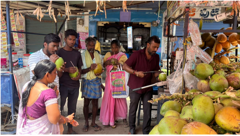
-వేడిమి నుంచి ఉపశమనం కోసం జ్యూస్ సెంటర్లను ఆశ్రయిస్తున్న జనం -వేసవిలో పుల్ గిరాకీ ఉంటుందంటున్న వ్యాపారులు