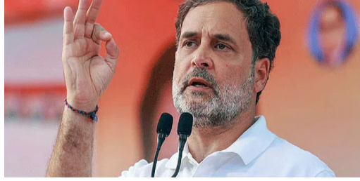
ఉన్నారు. ప్రభుత్వం ఈ అంశంపై దృష్టా సారించకుండా తప్పించుకోవడానికి ప్రయత్నిస్తోంది. ధర్మేంద్ర ప్రధాన్ రాజీనామా చేసే వరకు, భవిష్యత్లో ఇలా నీల్ పేపర్ లీకేజీ అరికట్టేలా తగిన చర్యలు తీసుకునేవరకు వరకు మా పోరాటం కొనసాగుతూనే ఉంది" అని రాహుల్ గాంధీ అన్నారు. నీల్ పేపర్ లీకే, రద్దు జరిగినప్పటి నుంచి కేంద్ర ప్రభుత్వంపై రాహుల్ గాంధీ విమర్శలు చేస్తూనే ఉన్నారు. మంత్రి ధర్మేంద్ర

న్యూఢిల్లీ మే 24 (సీలగిరి ఎక్స్ప్రెస్) నీల్ పేపర్ లీకేజీ ఘటనలో ప్రధాన బాధ్యుడిగా భావిస్తూ కేంద్ర విద్యాశాఖ మంత్రి ధర్మేంద్ర ప్రధాన్ రాజీనామా చేయాలని కాంగ్రెస్ అగ్రనేత, లోక్ సభలో ప్రతిపక్ష నేత రాహుల్ గాంధీ మరోసారి డిమాండ్ చేశారు. ఆయన రాజీనామా చేయడం లేదా పదవి నుంచి తొలగించడం జరిగితే వరకు తన పోరాటం ఆగబోదని ఆయన స్పష్టం చేశారు. ఈ అంశంపై ఆదివారం ఎక్స్ వేదికగా స్పందించారు. భవిష్యత్లో ఇలాంటి ఘటనలు జరగకుండా చూడాలన్నారు. లక్షలాది మంది యువత వీధుల్లో ఉన్నప్పుడు.. 22 లక్షల మంది పిల్లల భవిష్యత్ ప్రమాదంలో ఉన్నప్పుడు ప్రధాని మోదీ మౌనంగా