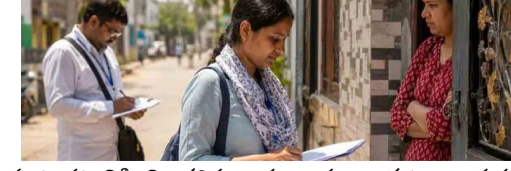
మాట్లాడటానికి నిరాకరిస్తున్నారు. ఆస్తులు, కుటుంబ సభ్యులు వివరాలు వెల్లడిస్తే ఆదాయ పన్ను శాఖ లాంటి ఏజెన్సీలు స్రూటీనీ చేస్తాయని భయపడుతున్నారు. దీంతో వాళ్లను

న్యూఢిల్లీ మే 24 (సీలగిరి ఎక్స్ప్రెస్) జనగణనలో ప్రభుత్వం ఆశించిన ఫలితాలు కనిపించడం లేదా! ఢిల్లీ మొదలుకొని పంజాబ్, మహారాష్ట్ర వరకు వివిధ రాష్ట్రాల్లో మండే ఎండల్లో ఎన్నుమరేటర్లు ఇంటింటికి వెళ్లి ప్రజలకు విజ్ఞప్తి చేస్తున్నా.. చాలా మంది తమ ఆస్తులు, వ్యక్తిగత వివరాలను వెల్లడించడం లేదు. తలుపులు తీసి