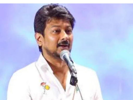
కారణమన్నారు. ఎంకే స్టాలిన్ ముఖ్యమంత్రిగా ఉండాలని ప్రజలు కోరుకున్నందుకే వారికి ఓటు వేశారు. కానీ ఈరోజు, కొన్ని పదవుల కోసం, మాకు

: వీసీకే అధినేత, సీఎం విజయ్ మైనారిటీ ప్రభుత్వానికి కాంగ్రెస్ మద్దతు ఇవ్వడంపై డీఎంకే నాయకుడు, యువజన విభాగం కార్యదర్శి ఉదయనిధి స్టాలిన్ ఆ పార్టీపై తీవ్ర స్థాయిలో విమర్శలు గుప్పించారు. ఈ సందర్భంగా ఉదయనిధి మాట్లాడుతూ.. డీఎంకే కార్యకర్తల మద్దతు, ముఖ్యమంత్రి ఎంకే స్టాలిన్ నాయకత్వంతో సీట్లు గెలుచుకున్నప్పటికీ కాంగ్రెస్ నాయకులలో కనీస కృతజ్ఞత, మర్యాద కూడా లేదని మండిపడ్డారు. అధికారం కోసం పార్టీని నమ్మించి వెన్నుపోటు పొడిచే కాంగ్రెస్ ను డీఎంకే క్యూడర్ ఎప్పటికీ నమ్మకూడదని, వారిని దరిదాపుల్లోకి కూడా రానివ్వద్దని విలుపునిచ్చారు. కాంగ్రెస్ ఐదుగురు ఎమ్మెల్యేలను గెలవడానికి డీఎంకే కార్యకర్తలే