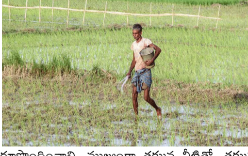
రూపొందించాలి. ముఖ్యంగా తక్కువ నీటితో, తక్కువ కాలంలో దిగుబడినిచ్చే పప్పుధాన్యాలు, చిరుధాన్యాలు, కూరగాయల పంటల సాగును ప్రోత్సహించాలని సూచించింది. ఎల్ నినో ప్రభావం తీవ్రంగా ఉండే అవకాశం ఉన్న ప్రాంతాల్లో కరవును తట్టుకునే విత్తన రకాలను అందుబాటులో ఉంచాలని, విత్తన నిల్వలు, నీటి యాజమాన్యంపై ప్రత్యేక శ్రద్ధ

న్యూఢిల్లీ మే 24 (సీలగిరి ఎక్స్ప్రెస్) ఈ ఏడాది ఎల్ నినో ప్రభావంతో నైరుతి రుతుపవనాలు బలహీనంగా ఉంటాయని, వర్షపాతం తక్కువగా నమోదయ్యే అవకాశం ఉందని భారత వాతావరణ కేంద్రం హెచ్చరించింది. ఈ నేపథ్యంలో కేంద్ర ప్రభుత్వం అప్రమత్తమైంది. రాబోయే ఖరీఫ్ సీజన్ లో రైతులు నష్టపోకుండా ఉండేందుకు ముందస్తు కార్యచరణ ప్రణాళికను ప్రారంభించింది. ఇందులో భాగంగా అన్ని రాష్ట్రాలకు కీలక ఆదేశాలు జారీ చేసింది. కేంద్ర వ్యవసాయ మంత్రిత్వ శాఖ జారీచేసిన ఆదేశాల ప్రకారం.. ప్రతి జిల్లాలో అక్కడి పరిస్థితులకు అనుగుణంగా పంటల ప్రణాళికలు