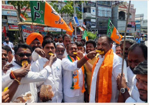
కాల్చి, స్వీట్లు పంచుకుని సంబరాలు జరిపారు. మహిళా రిజర్వేషన్ బిల్లును, డిలిమిటేషన్ ప్రక్రియను వ్యతిరేకించిన పార్టీలకు ప్రజలు తగిన బుద్ధి చెప్పారని