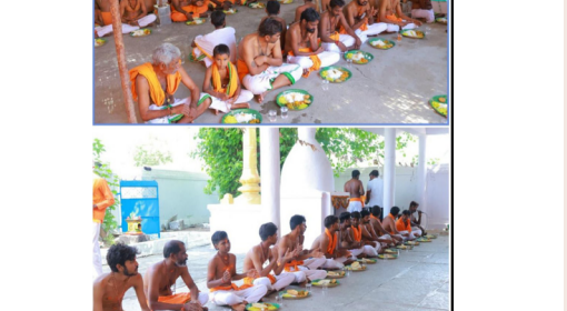
భక్తి సాక్షిగా హనుమాన్ స్వాములు