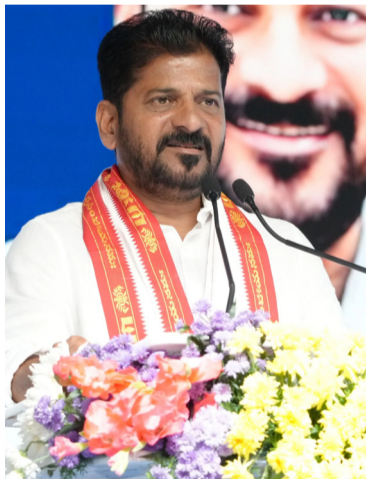
చేంజర్ గా మారిన రేవంత్ అభిప్రాయాలు వ్యక్తం అవుతున్నాయి. ముఖ్యంగా పీసీసీ అధ్యక్షుడిగా -మిగతా 2 లో

హైదరాబాద్ దేశరాజకీయాల్లో తెలంగాణ ముఖ్యమంత్రి రేవంత్ రెడ్డి పేరు మరోసారి చర్చనీయాంశంగా మారింది. కేరళలో కాంగ్రెస్ నేతృత్వంలోని యునైటెడ్ డెమోక్రటిక్ ఫ్రంట్ (యూడిఎఫ్) విజయం వెనుక రేవంత్ రెడ్డి అనుసరించిన వ్యూహాలు హస్తం పార్టీలో ఆసక్తిని రేపుతున్నాయి. ఈ దెబ్బతో రేవంత్ రెడ్డి ఇమేజ్ మరోసారి కాంగ్రెస్ అభిషేకం వద్ద మరంత పెరిగినట్లు రాజకీయ విశ్లేషకులు అంచనా వేస్తున్నారు. తనకు ఇచ్చిన అవకాశాన్ని వాడుకుని ఎల్ డిఎఫ్ ప్రభుత్వాన్ని గద్దె దించడంలో రేవంత్ రెడ్డి పోషించిన పాత్ర గేమ్