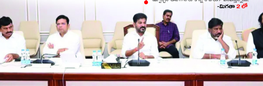
హైదరాబాద్ రాష్ట్ర మంత్రివర్గంలో ఛాన్స్ గా ఉన్న రెండు డెర్లు టీసీ, ఎస్టీ దక్కే అవకాశాలున్నాయి. ఇంకో రెడ్డి సామాజికవర్గానికి ఇచ్చేది లేదని ఏఐసీసీ, ఇటూ ముఖ్యమంత్రి ఏకాభిప్రాయంతో ఉన్నట్లు గిడ్డి కాంగ్రెస్ వర్గాల నమ్మకం. ప్రస్తుత మంత్రివర్గంలో ఇద్దరు లేదా మగ్గరిని తొలగించి వారి స్థానంలో కొత్త ముఖ్యమంత్రులు అవకాశం ఇవ్వచ్చనే ఊహగానాలు కొన్ని రోజులుగా వినిపిస్తున్నాయి. -మిగతా 2 లో