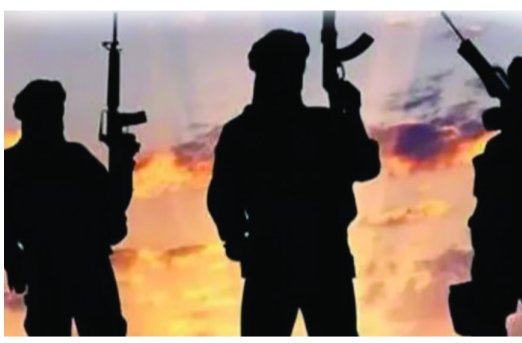
ప్రోత్సహించి, చిన్నచిన్న దాడులు చేయించడం ద్వారా లోయలో అశాంతిని సృష్టించడం. దీనివల్ల పర్యాటక రంగం దెబ్బతినడంతో పాటు సరిహద్దుల్లో మోహరించిన భారత భద్రతా బలగాల దృష్టిని అంతర్గత భద్రత వైపు మళ్లించవచ్చు. రెండో దశలో, ఈ అదను చూసి సరిహద్దుల్లోని లాండ్ ప్యాడ్లలో

రాజకీయ అకౌంట్లను ఉన్నాయని అధికారులు విశ్లేషిస్తున్నారు. దేశీయంగా తీవ్ర ఒత్తిడి ఎదుర్కొంటున్న అసీమ్ మునీర్, తన ప్రతిష్టను పెంచుకోవడానికి భారత్పై ఒక పెద్ద దాడిని ఉపయోగించుకోవాలని మాన్యువల్లు తెలుస్తోంది. అమెరికా-ఇరాన్ మధ్య శాంతి చర్చల్లో మధ్యవర్తిగా నిలిచి అంతర్జాతీయంగా గుర్తింపు పొందాలన్న ఆయన ప్రయత్నాలు విఫలమయ్యాయి. దీంతో ఆయన దృష్టి మళ్లీ భారత్పైకి మళ్లింది. కశ్మీర్ అంశాన్ని రగిలించడం ద్వారా పాకిస్థాన్లో తన ఇమేజ్ను పెంచుకుని, భవిష్యత్లో అధ్యక్ష పీఠాన్ని అధిరోపించాలనేది ఆయన దీర్ఘకాలిక ప్రణాళిక అని ఓ అధికారి తెలిపారు. ఇందుకోసం మునీర్ రెండంచెల పూర్వకాంతో ముందుకు వెళుతున్నారు. మొదటి దశలో, కశ్మీర్లోని స్థానిక యువతను ఉగ్రవాదం వైపు