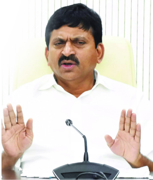
సమస్య మళ్లీ మొదటికి వచ్చిందని గుర్తు చేశారు. జర్నలిస్టుల సంక్షేమానికి తమ ప్రభుత్వం కట్టుబడి ఉందని దశాబ్దాల కాలంగా పెండింగ్లో ఉన్న ఇళ్ల స్థలాల సమస్యను పరిష్కరించేందుకు యుద్ధప్రాతిపదికన చర్యలు

అందులో సభ్యుల సంఖ్య, సభ్యత్వానికి అర్హతలు, ఇతర అన్ని అంశాలపై మంత్రిగారు సాఫైటీ సభ్యులు అడిగి తెలుసుకున్నారు. జవహర్ లాల్ నెహ్రూ హౌసింగ్ సొసైటీ మినహా మిగిలిన మూడు సొసైటీలలో సుమారు 2,424 మంది అర్హులైన జర్నలిస్టులు ఉన్నట్లు ప్రాథమికంగా గుర్తించారు. ఈ సందర్భంగా మంత్రి మాట్లాడుతూ.. జర్నలిస్టులు అందరూ ఒకేతాటిపై ఉంటే సమస్యల పరిష్కారం సులువు అవుతుందని, అన్ని సొసైటీలు కలిపి ఒకే వేదికపైకి వచ్చి జేపీసీ ఏర్పాటు చేసుకోవాలని సూచించారు. జర్నలిస్టు సంఘాలలో సభ్యులు కాని అర్హులైన జర్నలిస్టులకు కూడా ఇళ్ల స్థలాలు ఇస్తామని చెబుతూ ఎలాంటి విమర్శలకు, అనుమానాలకు తాపం ఉండరా ఇళ్ల స్థలాల మంజూరు జరిగేలా అందరూ సహకరించాలని కోరారు. గతంలో జర్నలిస్టులకు ఇళ్ల స్థలాలు ఇచ్చిన ఘనత కాంగ్రెస్ ప్రభుత్వాలదేనని, ఇప్పుడు కూడా ప్రజా ప్రభుత్వం వచ్చాక 18 ఏళ్లుగా పరిష్కారం కాని జవహర్ లాల్ నెహ్రూ జర్నలిస్ట్ హౌసింగ్ సొసైటీ ఇళ్ల సమస్యను కొలిక్కి తీసుకువచ్చి రవీంద్ర భారతిలో జర్నలిస్టుల కుటుంబాలతో సమావేశాన్ని ఏర్పాటు చేసి భూమి అప్పగించినప్పటికీ న్యాయవివాదాల కారణంగా