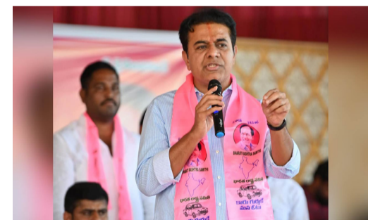
కూల్చివేతలు, ఎగవేతలు, పేల్చివేతలు మాత్రమే జరుగుతున్నవని తెలిపారు. వంద రోజుల్లో ఆరు గ్యాంపులను, ఎన్నికలకు ముందు దాన,వీర, శూర కర్ణ ఎన్నికల తరువాత కుంబకర్ణ పాత్రను పోషిస్తున్నారని దుయ్యబట్టారు. కోవిడ్ సమయంలో అందరూ ఇళ్లలో ఉంటే.. తాము రోడ్లు, వంతెనలు పూర్తి చేశామన్నారు. తెలంగాణ అంటే ప్రేమ ఉంది కాబట్టే.. లాక్డౌన్లో రోడ్లు, వంతెనలు నిర్మించాం. లాక్డౌన్ సమయంలో రాష్ట్రంలోని కార్మికులు స్వస్థలాలకు బయల్దేరారు.

చేసుకున్నారు. దీనిపై ప్రభుత్వం స్పందించడం లేదు. రెండోట్లో భరించండి.. కేసీఆర్ వచ్చి కార్మికులకు మేలు చేస్తారని కేటీఆర్ అన్నారు. బీఆర్ఎస్ ప్రభుత్వం కార్మికులకు చేతనించా పని కల్పించి ఆదుకున్నదని, నగరంలో రోడ్లు, వంతెనల నిర్మాణం చేపట్టమని వెల్లడించారు. కోవిడ్ సమయంలో ఇతర రాష్ట్రాలకు వెళ్లేందుకు కార్మికులకు ఉచిత రైళ్లను కేసీఆర్ ఏర్పాటు చేశారని గుర్తు చేశారు. కాంగ్రెస్ హయాంలో అవినీతి వల్ల, అసమర్థత వల్ల ఎన్ఎల్ఏల కుప్పకూలిపోయి చనిపోయిన కార్మికులను అప్పగించలేని దుస్థితిలో ప్రభుత్వం ఉందని ఆరోపించారు. సంగారెడ్డి జిల్లా సిగావీ పరిశ్రమలో అగ్నిప్రమాదం జరిగి 60 మంది నజీవరహసం అయితే పట్టించుకున్న నాభుత్వే తేరని దుయ్యబట్టారు. కోటి రూపాయల నష్టం పరిహారం ఇస్తామని రేవంత్ హామీ ఇచ్చి ఇప్పటి వరకు ఇవ్వలేదని విమర్శించారు. నగరంలో వలసవచ్చి నివాసమేర్పాటుకున్న కార్మికుల ఇళ్లను హైద్రా పేరిట కూల్చి రోడ్డుపాలు చేస్తుందని ఆగ్రహం వ్యక్తం చేశారు. కాంగ్రెస్ పాలనలో