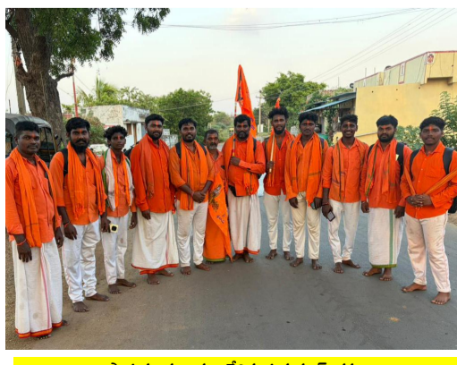
పాదయాత్ర బయలుదేరిన హనుమాన్ భక్తులు