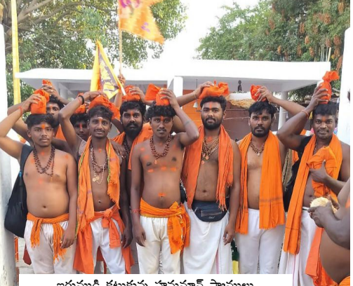
అరుముడి కట్టుకున్న హనుమాన్ స్వాములు