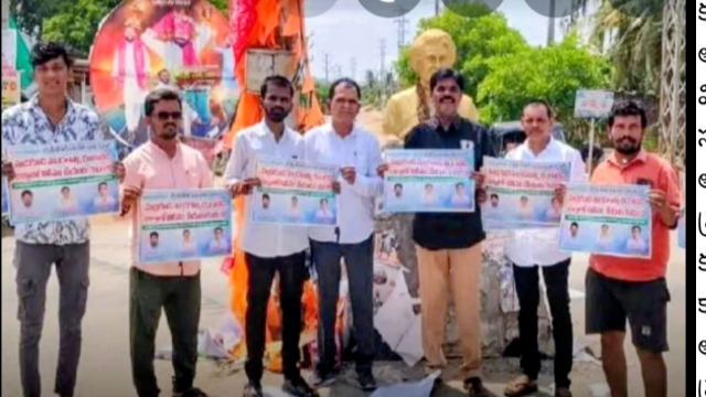
వేగంగా పూర్తిచేయాలని పేర్కొన్నారు. విలీనం జరిగితే పరిశ్రమలు, కంపెనీలు స్థాపించబడి స్థానిక యువతకు ఉద్యోగ అవకాశాలు విస్తృతంగా లభిస్తాయని, రైతులకు భూముల ధరలు పెరగడం ద్వారా ఆర్థిక లాభం