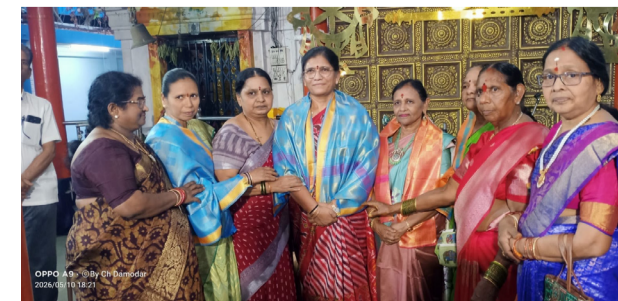
తెలిపారు. కార్యక్రమంలో 60 సంవత్సరాలు దాటిన 103 మంది వృద్ధ మాతృమూర్తులను సంప్రదాయ పద్ధతిలో సత్కరించారు. ప్రత్యేక అతిథులుగా సీనియర్