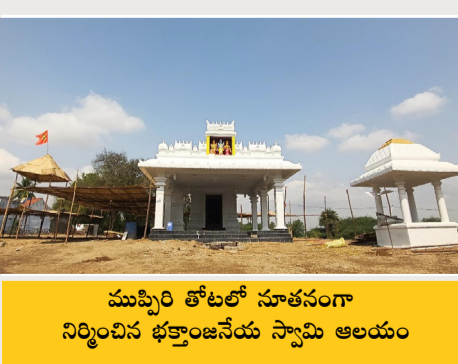
ముప్పిరి తోటలో సూతనంగా నిర్మించిన భక్తాంజనేయ స్వామి ఆలయం