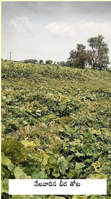
నేలవారిస బీర తోట