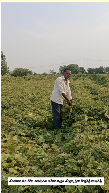
నేలవారిస బీర తోట చూపుతున్న ఎంపీ సీనియర్ ఎడిటర్స్