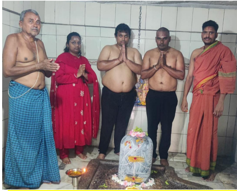
భవని రామలింగేశ్వర ఆలయంలో ప్రత్యేక పూజలు