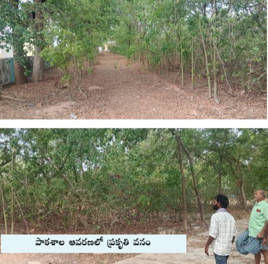
పాఠశాల ఆవరణలో ప్రకృతి వనం