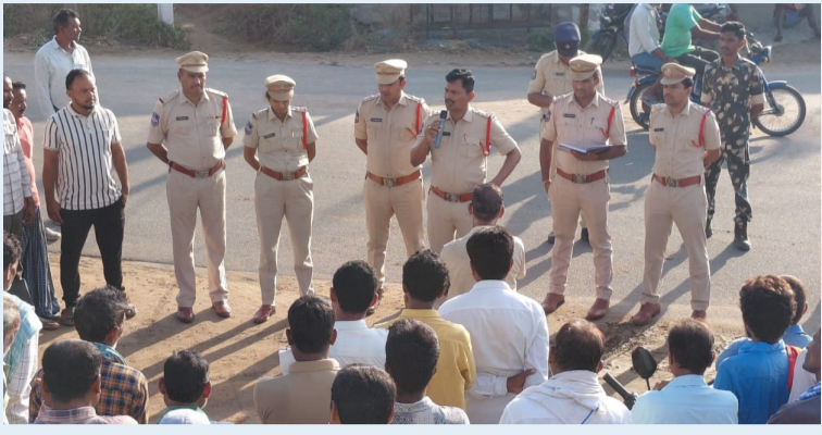
పెద్దపల్లి, జూన్ 2 (సీలగిరి ఎక్స్ ప్రెస్)