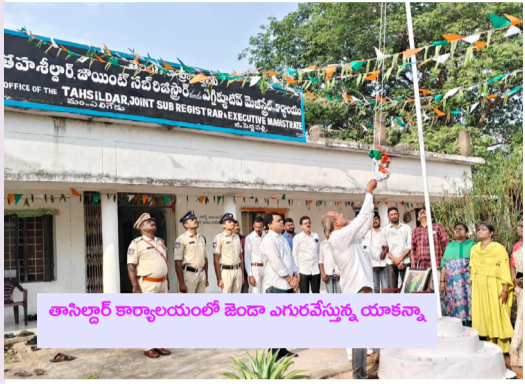
తాన్సిలాడ్ కార్యాలయంలో జేండా ఎగురవేస్తున్న యాత్రకు