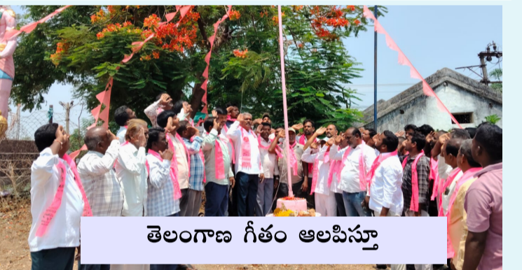
తెలంగాణ గీతం ఆలపిస్తూ