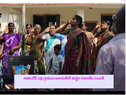
చాలాదేవ్ వద్ద గ్రామపంచాయతీ కార్యాలయంలో యాత్ర వేడుకలు గా