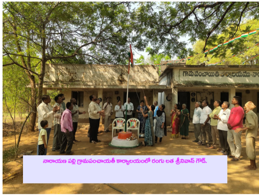
తాన్సిలాడ్ వద్ద గ్రామపంచాయతీ కార్యాలయంలో యాత్ర వేడుకలు గా