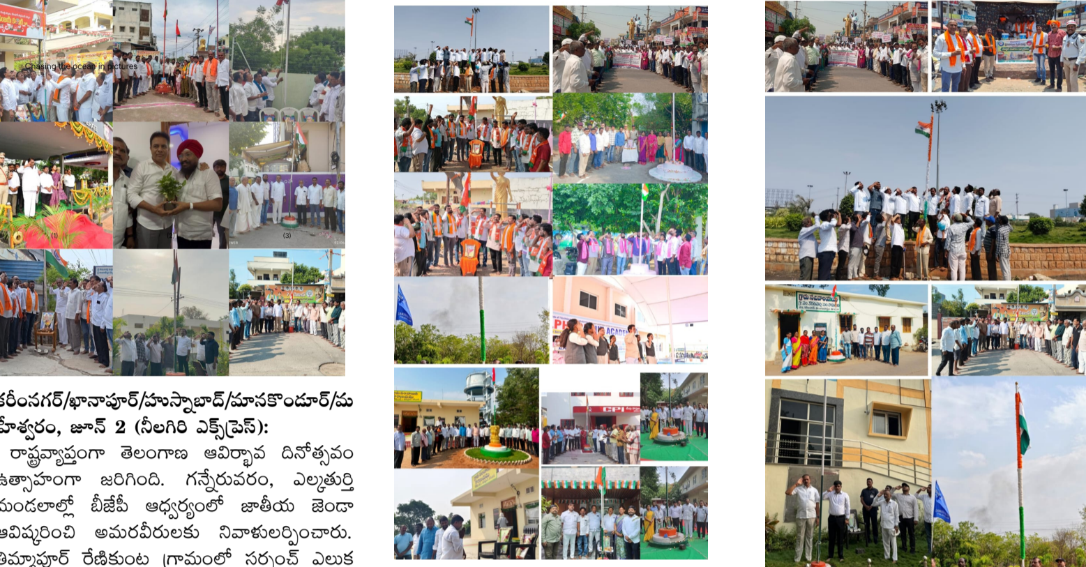
కరీంనగర్/ఖానాపూర్/హుస్సాబాద్/మానకొండూర్/మహేశ్వరం, జూన్ 2 (సీలగిరి ఎక్స్ ప్రెస్):