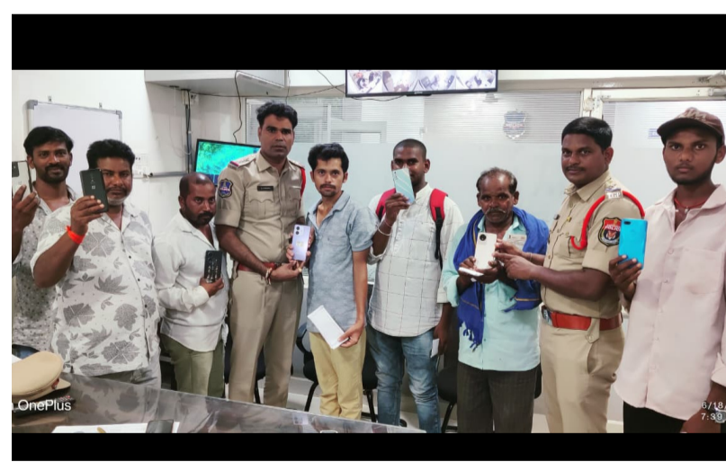
కరీంనగర్, జూన్ 18 (సీనియర్ ఎక్స్ ప్రెస్):