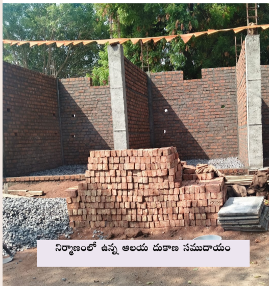
నిర్మాణంలో ఉన్న అలయ దుకాణ సముదాయం

ఎలిగేడు, జూన్ 18 (నీలగిరి ఎక్స్ ప్రెస్): ఎలిగేడు మండల కేంద్రంలోని అతి ప్రాచీనమైన కోదండ రామాలయం అభివృద్ధి కోసం గ్రామంలోని పలువురు ప్రముఖులు, గ్రామస్థులు కలిసి అలయ ఆవరణలో దుకాణ సముదాయాలను నిర్మించేందుకు శ్రీకారం చుట్టారు. ఈ ఆలయంలో క్షేత్రపాలకుడిగా హనుమంతుడు, నవగ్రహాలు, ధ్వజస్తంభం, గరుత్మంతుడు, శ్రీరాముడి పట్టాభిషేక పరివారం భక్తులను ఆకర్షిస్తాయి. అదేవిధంగా అరుదుగా లభించే సాలగ్రామాలు ఆలయంలో ఉండటం ఆలయ పవిత్రతను మరింతగా చాటుతోంది. అయితే,