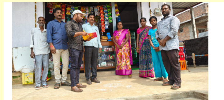
సుల్తానపూర్ లో బడి బాటపై ఇండియా తిరుగుతూ అవగాహన కల్పిస్తున్న ఉపాధ్యాయులు