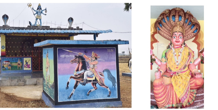
రేణుక ఎల్లమ్మ బోనాలకు ముస్తాబైన దేవాలయం